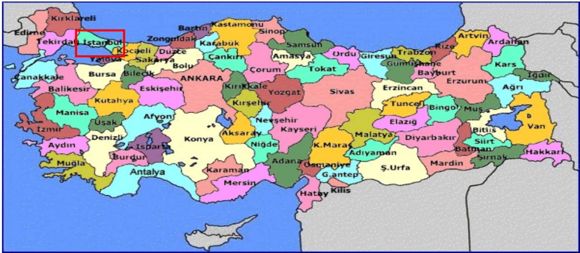
Harita 1 - İstanbul'un Konumu

İstanbul, Türkiye'nin en büyük kenti olup, 13 milyon kişiyi aşan nüfusu ile dünyanın da sayılı kentlerinden biri haline gelmiştir. Batı ile Doğu arasında köprü olma özelliği ile yerli ve yabancı sermaye için, bölgelerarası ilişki kurma ve bölgelere açılma yönünden önemli bir merkezdir. İstanbul Boğazı, Karadeniz'i, Marmara Denizi'yle birleştirirken; Asya Kıtası'yla Avrupa Kıtası'nı birbirinden ayırmakta ve İstanbul kentini de ikiye bölmektedir.